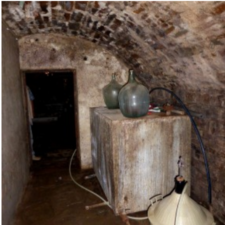
Reste der einstigen Destillerie.