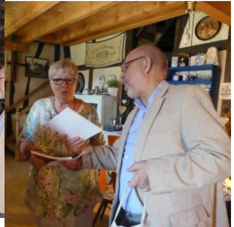
Dank und Verabschiedung nach einem interessanten Nachmittag.