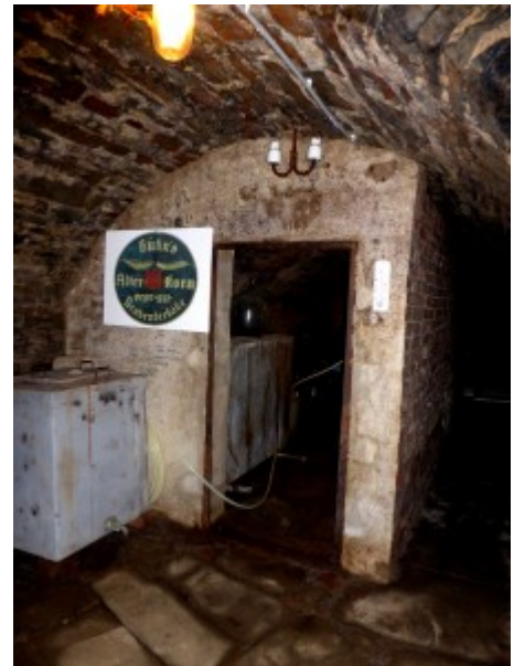
Reste der einstigen Destillerie.

Bei einer Führung durchs Haus konnten die Relikte dieser Aktivitäten in Landwirtschaft, Handel und Produktion besichtigt werden, so der kühle Keller der Destillerie mit den versiegelten Metallbehältern für den Kornbrand und dem Brunnen. Interessant war u. a. auch ein Kontobuch aus dem Jahr 1913, das den Vertrieb der Produktion auf Mark und Pfennig festhielt. 150 Jahre lang war im Haus auch eine Bierbrauerei. In