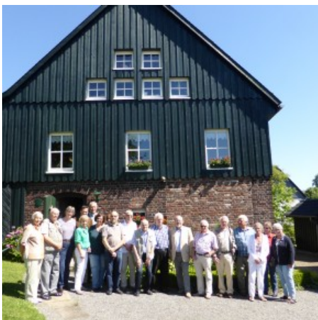
Mitglieder und Gäste vor der „Grünen Scheune“