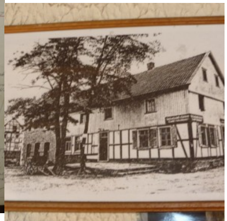
Einführende Worte von