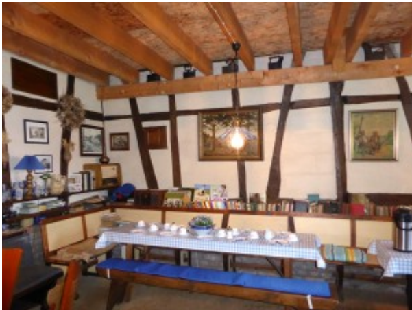
Vorbereitung für die Gäste.