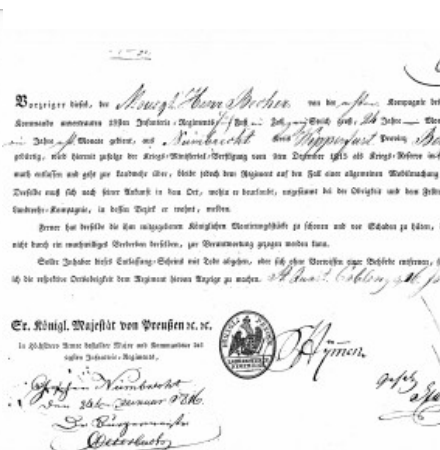
Entlassungspapier für H. Becher, Koblenz, 1816