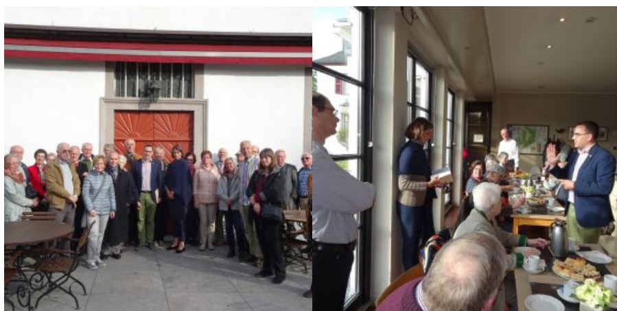
Gruppe vor dem Schloss