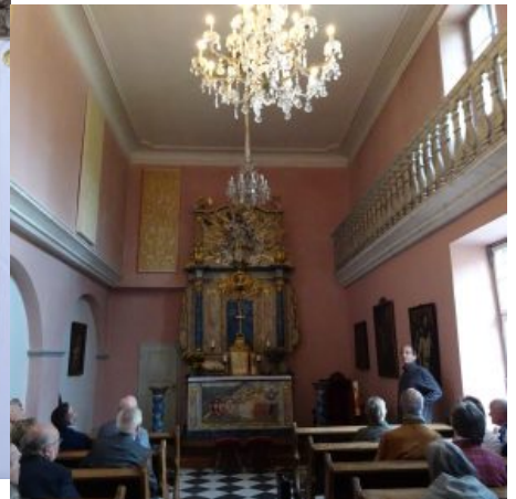
Nepomukkapelle - beliebt als Traukirche