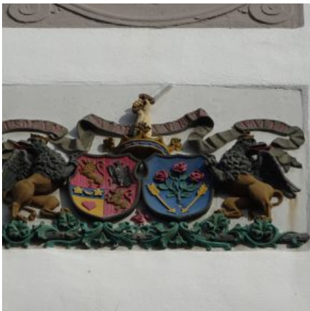
Allianzwappen mit „von la Valette“