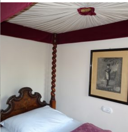
Napoleons Bett - heute als Einzelzimmer buchbar