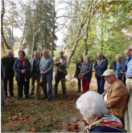
Mitglieder und Gäste