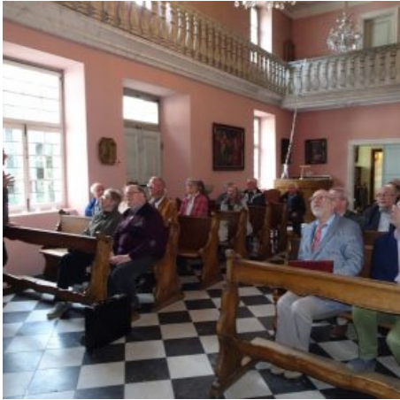
Besucher in der Kapelle