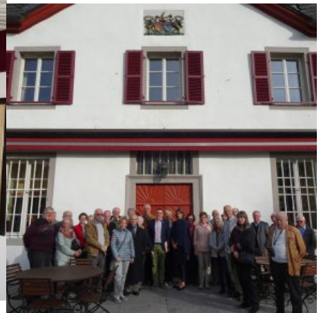
BGV-Gruppe vor dem Schloss