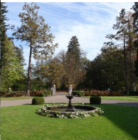
Schlosspark mit altem Baumbestand