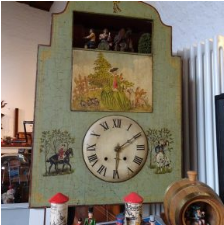
Schwarzwälder Uhr 1850 zum Badischen Aufstand