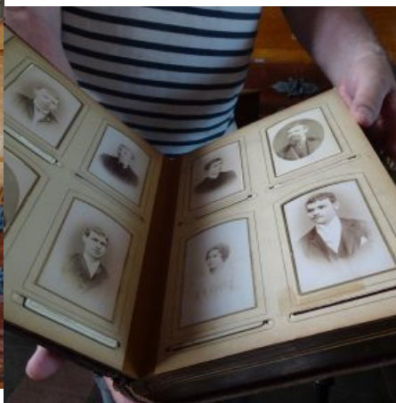
Fotoalbum mit Plattenspielwerk