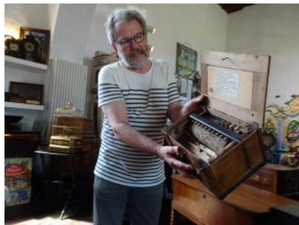
Spieluhr aus dem 18. Jahrhundert