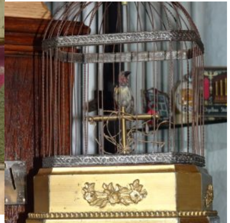
Französische Vogelspieluhr mit Münzeinwurf