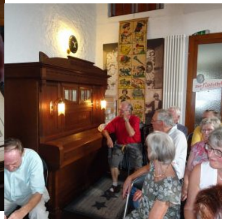
Orchestrion von 1925