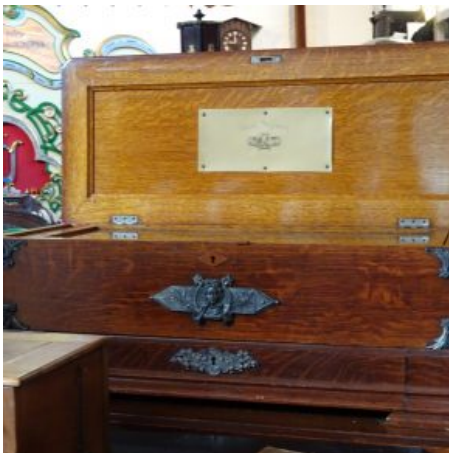
Schweizer Spieluhr mit neun Walzen und 54 Musikstücken