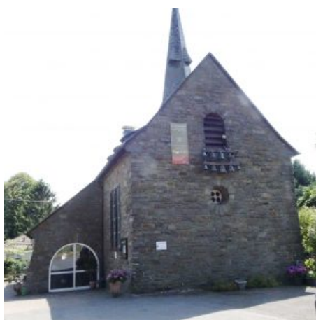
Ehemalige Kirche Kempershöhe, jetzt