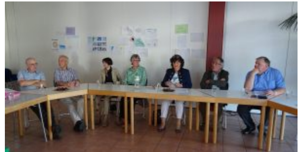
Mitglieder und Gäste beim Vortrag